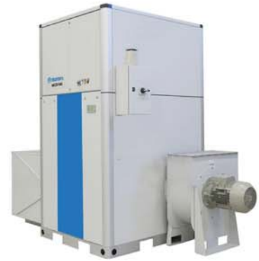
Dezumidificatoare Munters Seria MCD 10 000 - 15 300 m 3 /h