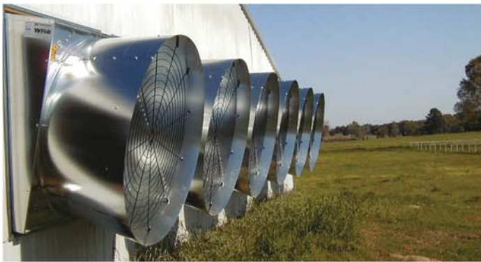
Sisteme de ventilatie Munters