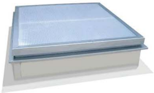
Luminator de acoperis Sunvia Nano