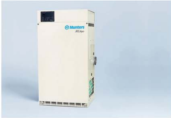
Dezumidificatoare Munters Seria ML 180 - 1700 m 3 /h

Emtec Electromecanic va ofera o gama larga echipamente profesionale Munters pentru controlul temperaturii (incalzire, racire), controlul umiditatii (umidificare si dezumidificare chimica), sisteme eficiente de climatizare pentru sere, ferme de animale, precum si solutii industriale de protectie a mediului.