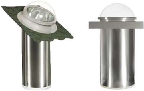
Sistemul Sunvia Tube – Iluminare naturala

Sistemul Sunvia Daylighting iti permite sa folosesti lumina naturala a soarelui pentru iluminarea interioara, asigurand lumina naturala consistenta pe parcursul zilei. Sunvia functioneaza cu consum zero de energie, ajutand astfel la reducerea costurilor cu iluminarea. Se diminueaza cantitatea de caldura degajata de sursele de iluminare artificiala, scazand astfel costurile cu energia consumata pentru folosirea sistemelor de aer conditionat.