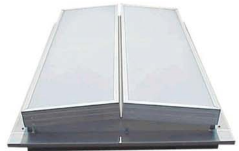
Sunvia Vent ofera un mediu curat, proaspat si sanatos prin ventilatie naturala