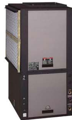
Pompa de Caldura Verticala apa-aer ClimateMaster