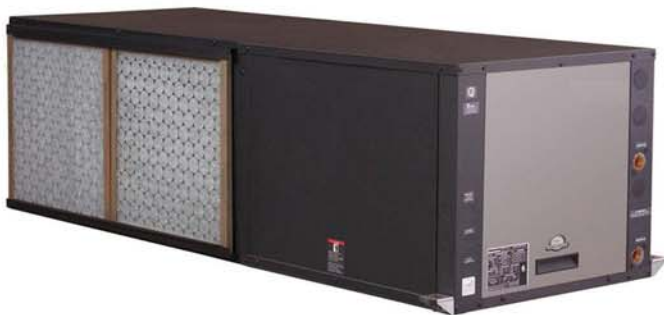
Pompa de Caldura Orizontala apa-aer ClimateMaster