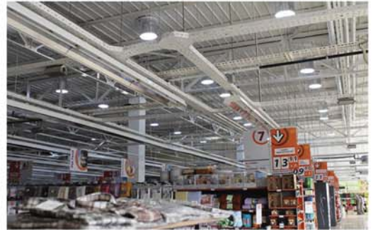
Sunvia - Economie de energie