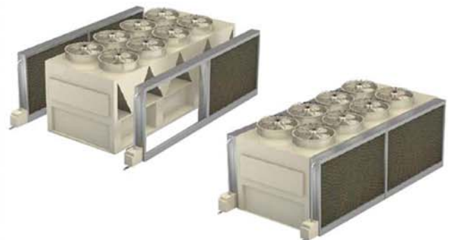
Unitati de Pre-Racire prin Evaporare pentru Condensatoare - FesChill