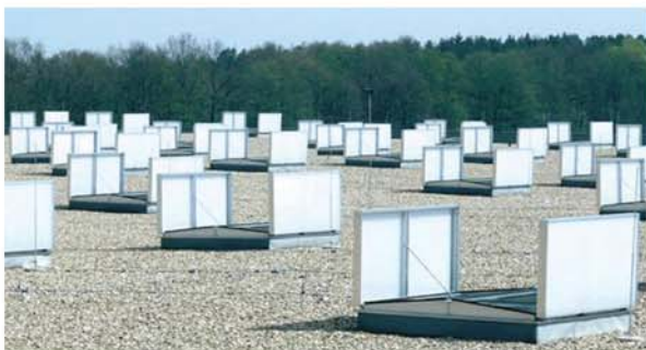
Sunvia Vent asigura iluminarea naturala in timpul ventilatiei