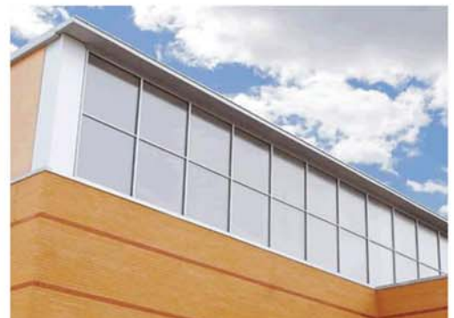
Sistem de iluminare destinat fatadelor Sunvia Wall