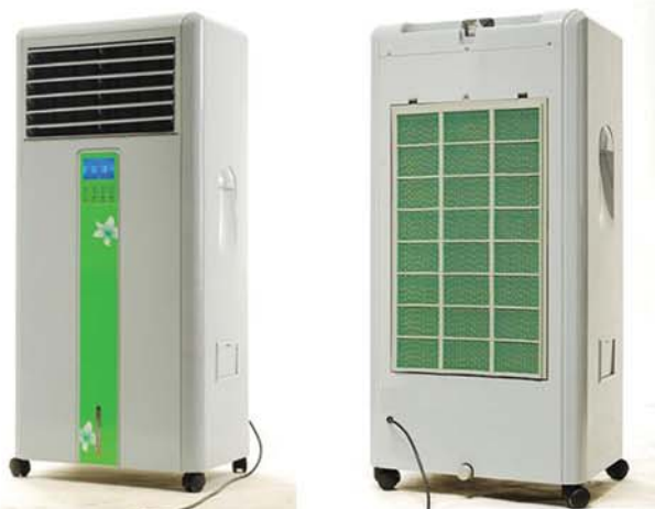
FesKlima - FesCafe