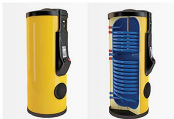
Rezervoare de Apa Calda Ezinc Seria "G" suprafata interioara acoperita cu email si izolatie din poliuretan de inalta densitate