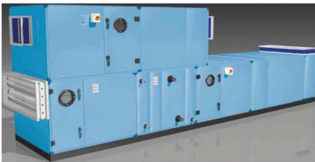
Unitati de Tratare a Aerului FORM