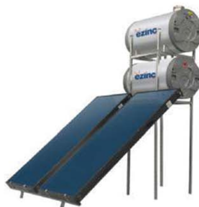
Sisteme Ezinc de Incalzire Solara a Apei Akdeniz