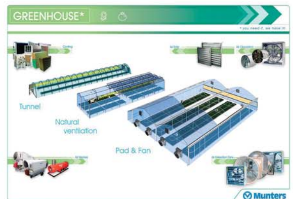
Sisteme complete de climatizare pentru sere