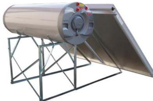
Sistemul Termosifon Ezinc - colectoare solare, rezervoare emailate de apa calda si suport adecvat pentru toate tipurile de acoperis