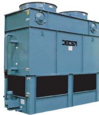
Turnuri de Racire Decsa Capacitate de racire: 70 - 6153 kW