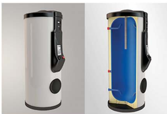
Rezervoare de Apa Calda Tampon Ezinc Seria "A" necesare atunci cand trebuie stocate cantitati mari de apa calda