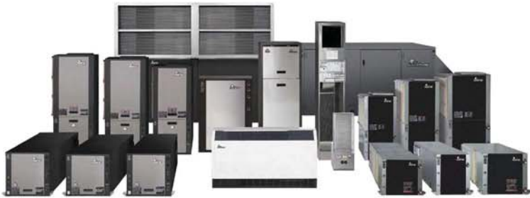
Gama completa de Pompe de Caldura si Pompe de Caldura Geotermale ClimateMaster

Emtec Electromecanic va ofera solutii profesionale pentru sisteme incalzire-racire cu Pompe de Caldura si Pompe de Caldura Geotermala ClimateMaster USA .