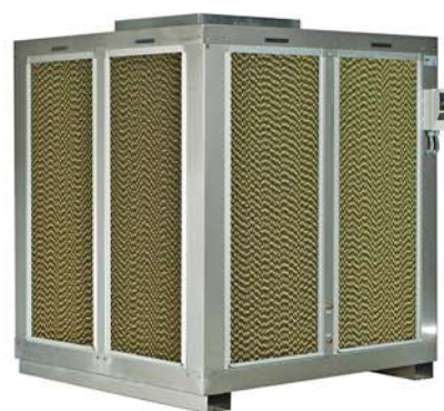
FesKlima - FesPack