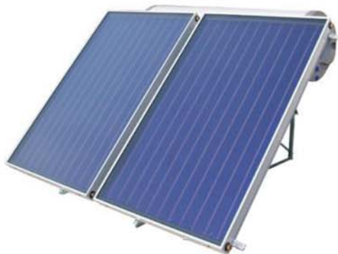
Sisteme de incalzire solara Ezinc – randament ridicat, durabilitate, aspect estetic

Va oferim posibilitatea de a folosi energia solara pentru confortul locuintei dumneavoastra prin sisteme moderne de colectoare solare Ezinc cu randament ridicat si panouri fotovoltaice. Cu ajutorul sistemelor de incalzire solara de inalta eficienta combinate cu sistemul de incalzire electrica cu termostat este posibila obtinerea apei calde pe tot parcursul anului, atat ziua cat si noaptea.