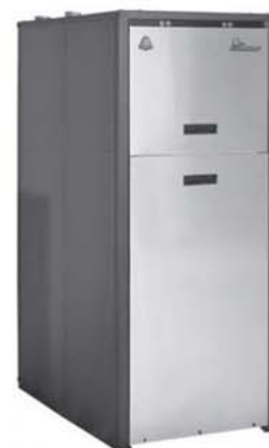
Pompa de Caldura Verticala apa-apa ClimateMaster