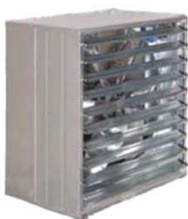
FesKlima - Ventilatoare de evacuare