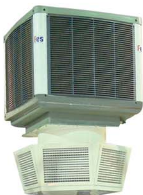
FesKlima - FesPlast