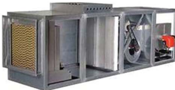
Unitati de Racire prin Evaporare si Incalzire Indirecta - FesHeat