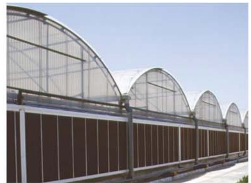
Sisteme de racire cu panouri Munters