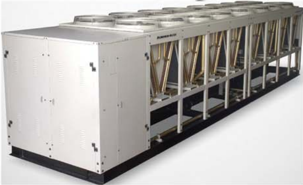
Chillere Dunham-Bush Capacitate de racire: 299 - 1832 kW

Emtec Electromecanic va ofera o gama larga echipamenete HVAC precum si solutii tehnice pentru realizarea si optimizarea proiectelor electromecanice.