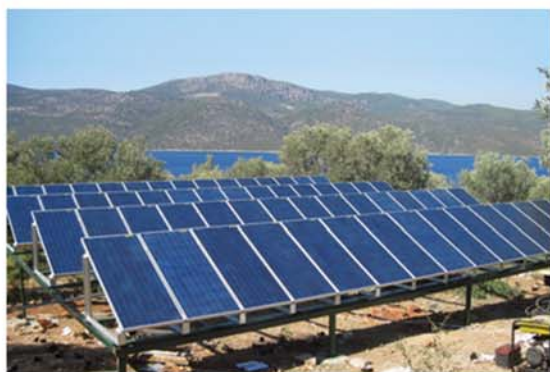
Panouri Solare Fotovoltaice - PV