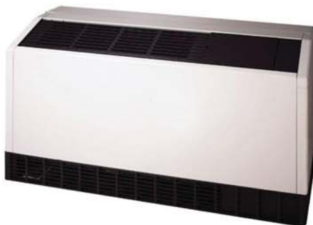
Pompa de Caldura in consola ClimateMaster