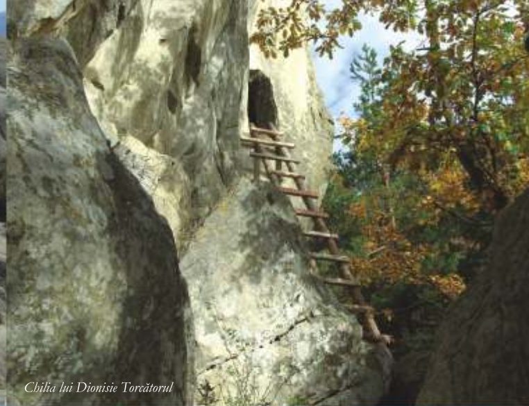
Chilia lui Dionisie Torcătorul