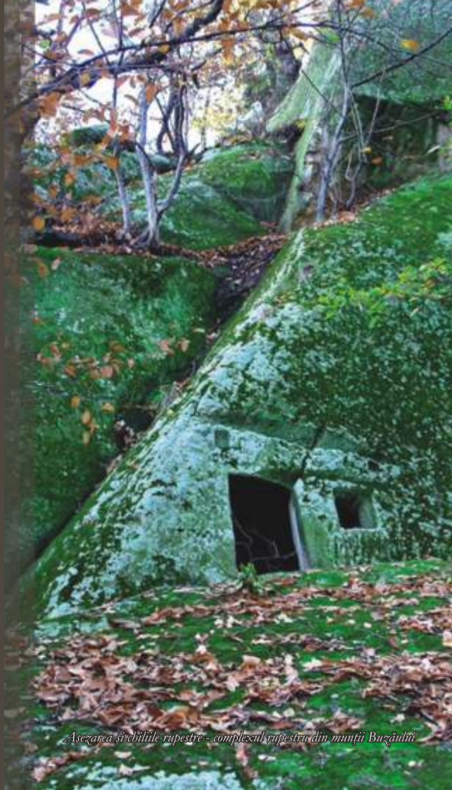
Așezarea și chilile rupestre - complexul rupestrii din munții Buzăului

„Demult, tare demult, dincolo de munte era „Țărâmul Luanei”, Luana fiind o ființă atotputernică ce păzea cu strășnicie porțile unei cetăți cu ziduri imense deasupra căreia strălucea atât noaptea, cât și ziua un soare aidoma astrului zilei. Și cetatea era locuită de niște oșteni viteji întru dreptate și netemători de moarte. Oștenii răniți în lupte erau conduși de Luana în „Valea Izvoarelor”, cele dătătoare de apă vie și de apă moartă; și spălându-și rănilor cu acele ape miraculoase, aceștia se vindeau pe loc. Numai Luana cunoștea tainele izvoarelor. Cei care se încumetau să le încerce singuri se îmbolnăveau pe loc și mureau. Și au trăit cei din cetate ani mulți sub oblăduirea Luanei până ce au luat seama vrăjmași puternici, care, mânați de pizmă au venit, în care de foc, și au doborât soarele cetății. Și când soarele s-a prăbușit, pământul s-a cutremurat din temelii și mare prăpăd a fost pe lume... Și de atunci pe locul cetății, mulți ani nici iarba n-a crescut și nici glas de pasăre nu s-a auzit și nici picior de fiară n-a mai călcat. Despre toate acestea vorbesc semnele tainice din Peștera Înțeleptului.”