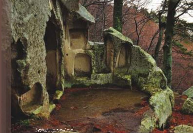
Schitul Agatonul nou

Localnicii spun că „Țara Luanei“ este „Poarta lui Dumnezeu“. Un grup de cercetători japonezi au constatat că aici se află al treilea pol energetic al Pământului ca importanță, primul fiind pe Vârful Omu.