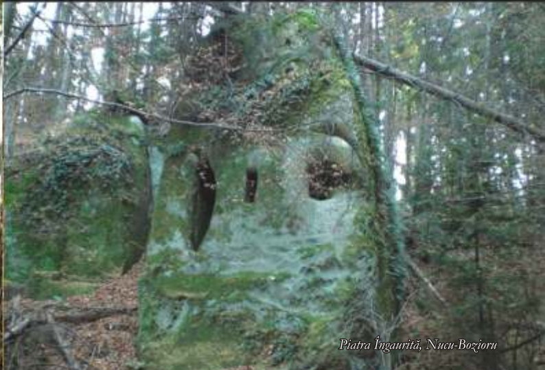
Piatra Îngauriță, Nucii-Bozioru