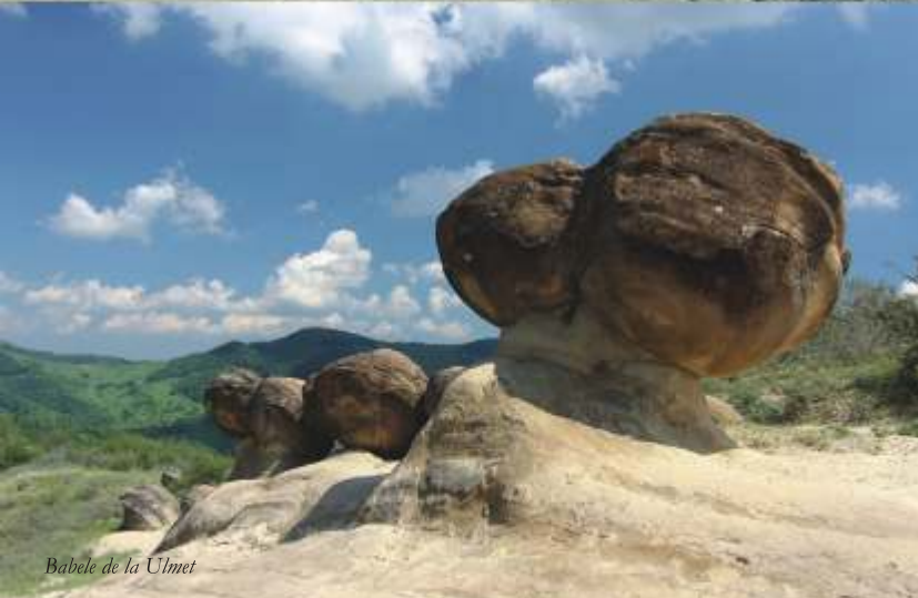
Băbele de la Ulmet