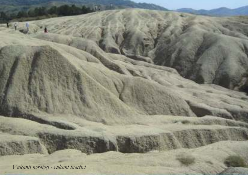
Vulcanii noroșii - vulcani inactivi