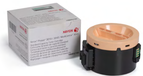
Cartuș toner capacitate standard