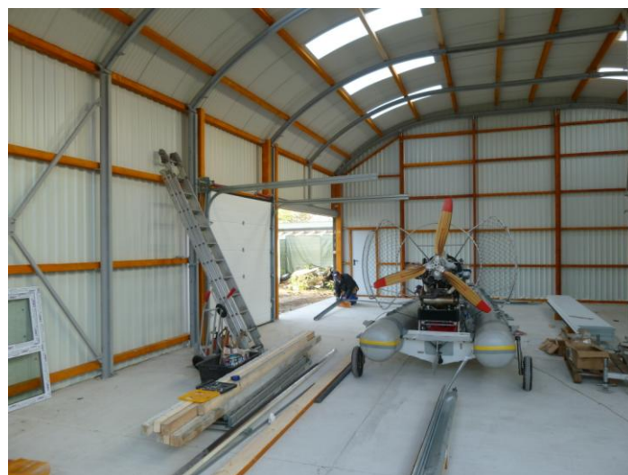
Interior cu poartă laterală

Contactați-ne și vă consiliem cu plăcere pentru orice extraopțiune.