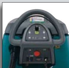
Sistem de control