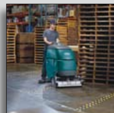
Mașină în acțiune