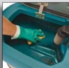
Rezervor ușor de curățat