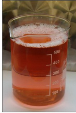
R.C. BIOENERGY SUPER CLEAN Prodotto sgrassante – disossidante - decontaminante