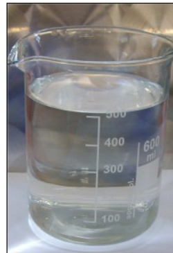
R.C. SERINOX: Prodotto per elettromarcatura

Produsele au diferite culori pentru a fi identificate usor.