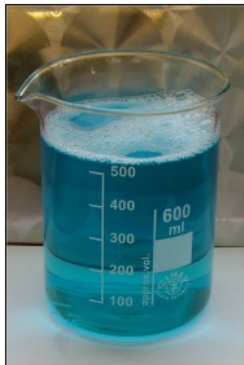
R.C. BIOENERGY SUPER PASS: Prodotto passivante