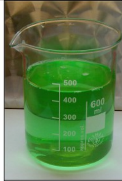
R.C. BIOENERGY SUPER DEC: Prodotto decapante