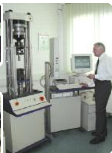
Test rezistență mecanică

WASI Group a fost certificat în concordantă cu prevederile ISO 9001 Quality Management System încă din 1993. Acest certificat ne obligă ca an de an să optimizăm procedurile de lucru si sistemul de organizare - totul spre avantajul clientilor nostrii. Tehnologiile de control dezvoltate si laboratorul de chimie metalurgică dotat cu cele mai noi echipamente de analiză ne asigură o constantă în ceea ce privește calitatea produselor.