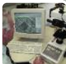
Test determinare duritate