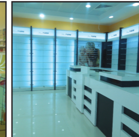
Farmacile Minifarm Constanta - Tulcea