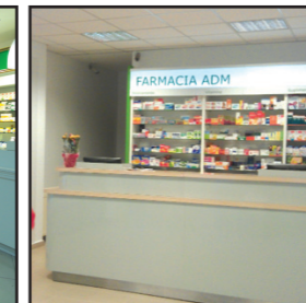
Farmacile ADM Bucuresti