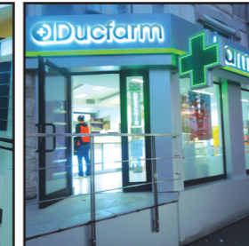
Farmacile Ducfarm Cluj - Turda