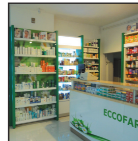
Farmacile Eccofarm Turnu Severin