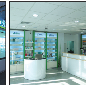
Farmacile Prima Craiova