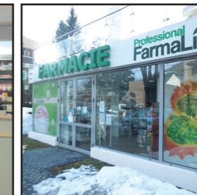
Farmacile Professional FamaLine Prahova