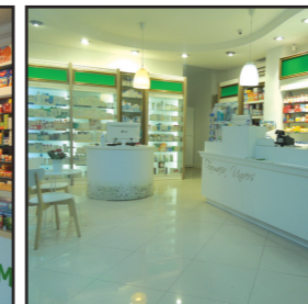
Farmacia Univers Constanta