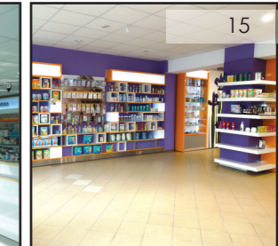
Farmacile Seti Prahova